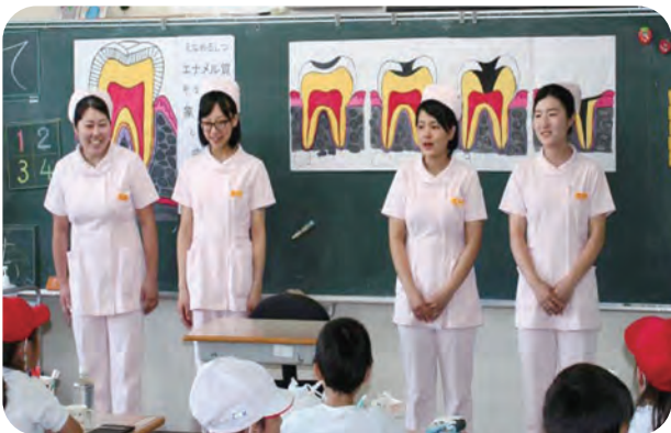
*わくわく・ドキドキの衛生教育