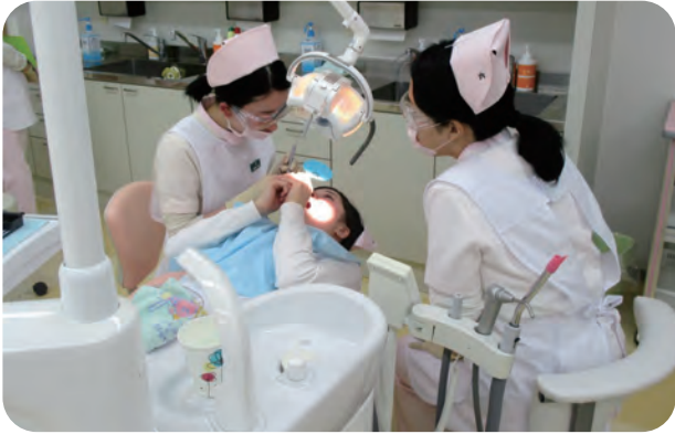
*臨床実習室で相互実習です ステップアップ