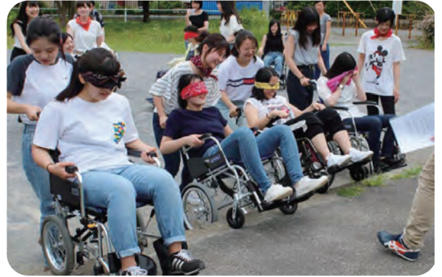
*車いす体験実習中