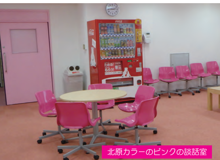
北原カラーのピンクの談話室