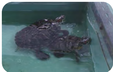
カメのベリーとマカロン