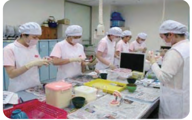
*もくもくと印象材の練和練習です