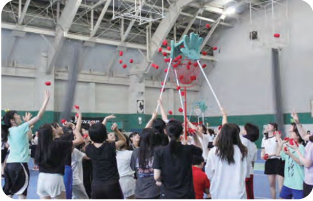
*レクリエーションの玉入れ 大きな手がブロック