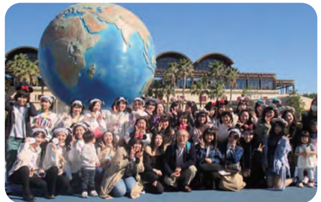
*楽しいディズニーシーの修学旅行