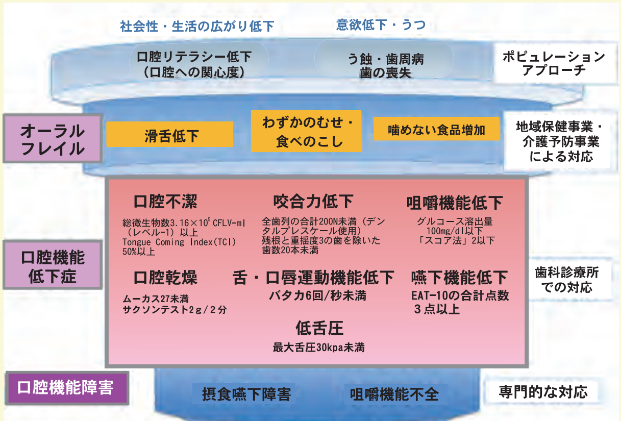
図1. 「口腔機能低下症」概念図

「オーラルフレイル」は、滑舌低下、食べこぼし、わずかなむせ、噛めない食品が増える、口の乾燥などの些細な口腔機能の低下から始まる身体の衰え(フレイル)の一つです。この「オーラルフレイル」とは、健康と機能障害との中間にあり、可逆的であることが大きな特徴の一つです。つまり早めに気づき適切な対応をすることでより健康に近づきます。些細な症状なので見逃しやすく、気が付きにくいため注意が必要です。