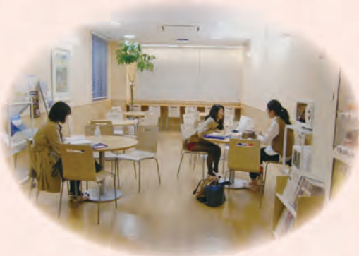
おしゃれな談話室