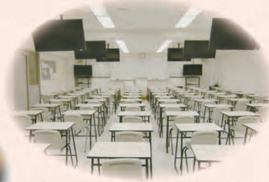
教室にたくさんのモニターがつけました