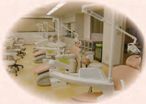
臨床実習室にはユニット15台