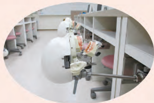
現在のマネキンです