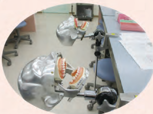
古いマネキンもまだ活躍しています