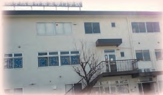
残念ながら1号館は地震で壊れてしまいました。