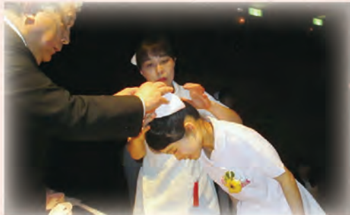
伝統の戴帽式は森のホールで行っています