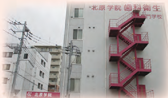
NEW校舎。素敵なおピンクの非常外階段です